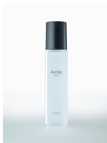
Aetās The Lotion

肌の角層すみずみまで潤す高速浸透化粧水。ミネラルやビタミンをすみずみまでいき渡らせるため、肌の構造に似せた水分と油分の層が交互に重なり合った毛穴より小さいカプセル「ビューティ・コア・ロケット(BCR)®」を独自開発。肌に触れた瞬間外側から1層ずつカプセルが剥がれ、内包された水溶性と油溶性の栄養豊富な成分が肌へ素早くなじみます。